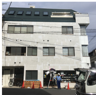
外壁・屋根等リフォームの Before→After