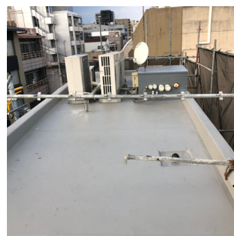
屋根・屋上リフォームの After

屋根は既存屋根材を残してガルテクトカバー工法という工法にて葺き替えし、トップライトも取り替えました。屋根勾配が急勾配のため苦戦しました。屋上は断熱カバー工法にて防水しました。これで雨漏れ対策はバッチリです！