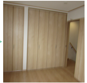
内装工事（和室→洋室）の Before→After（宇治市・M様邸）