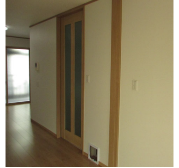
内装工事（リビング／開き戸→引戸）の Before→After