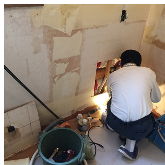
リフォーム工事中！