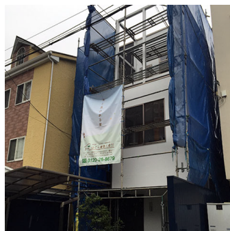
フローア材の貼り替え中&外壁塗装中です♪