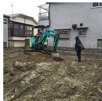
地盤調査後、いよいよ基礎着工です！！

そして、ずっと打合せをさせて頂いていた新築工事の現場も、先日いよいよ着工しました！！5月に棟上げ予定です。随所にこだわりをたくさん詰め込んだ素敵なプランになりました。今から完成が楽しみです(^-^)